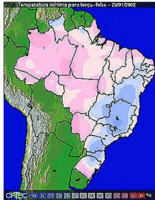
Mapa ilustrativo das temperaturas mínimas em todo o país, resultante da aplicação dos modelos.

Ainda segundo o pesquisador, hoje o CPTEC tem um projeto no qual, paralelamente ao modelo, se está reformulando e introduzindo todas as tecnologias modernas que já existem. "Nós já dominamos totalmente o modelo e consideramos que é um modelo